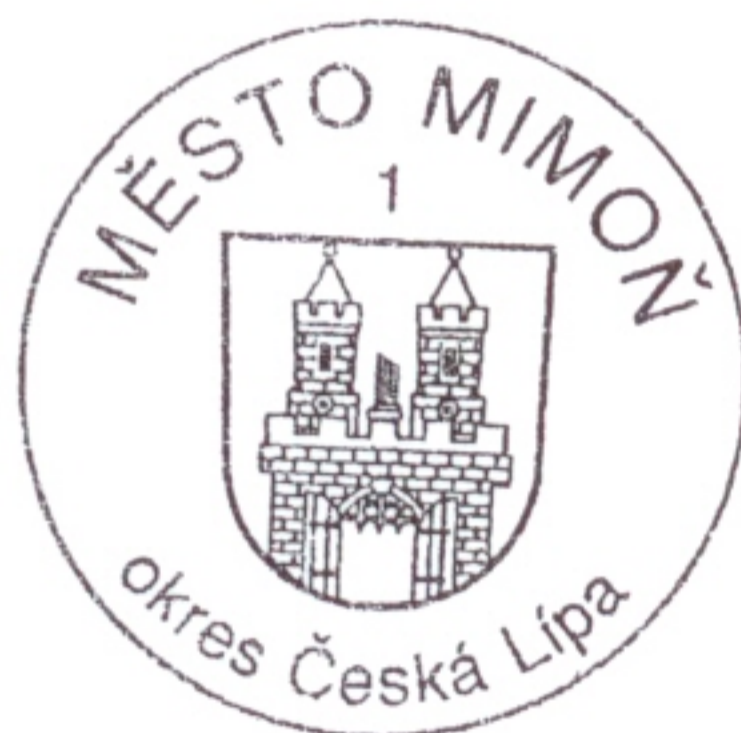
František Kaiser starosta města

Zastupitelstvo města Mimoň s c h v a l u j e s účinností od 1.5.2010 Zásady podpory výstavby rodinných domů na území města Mimoň , které jsou přílohou usnesení.