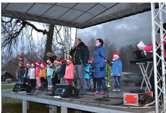
Zpívání pod vánočním stromem