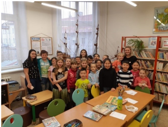
Beseda v knihovně