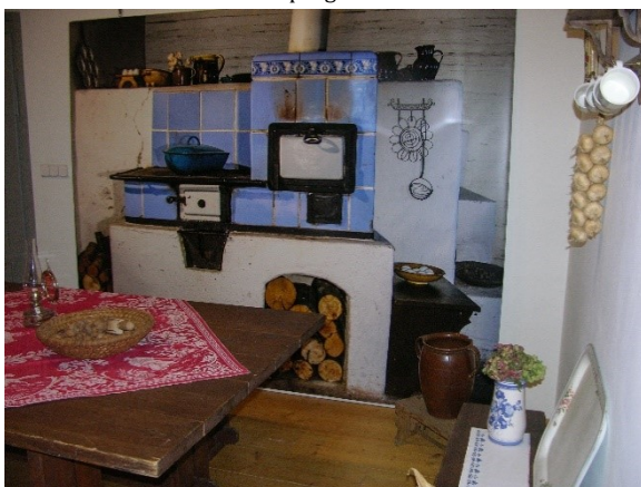
Výstava „Za dlouhých zimních večerů“