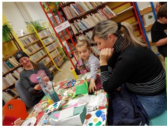
Vánoční dílny v knihovně