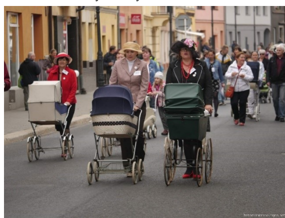
Setkání historických kočárků