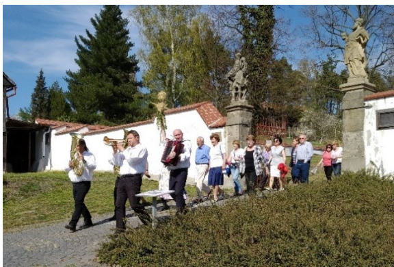
Celodenní velikonoční program u Městského muzea