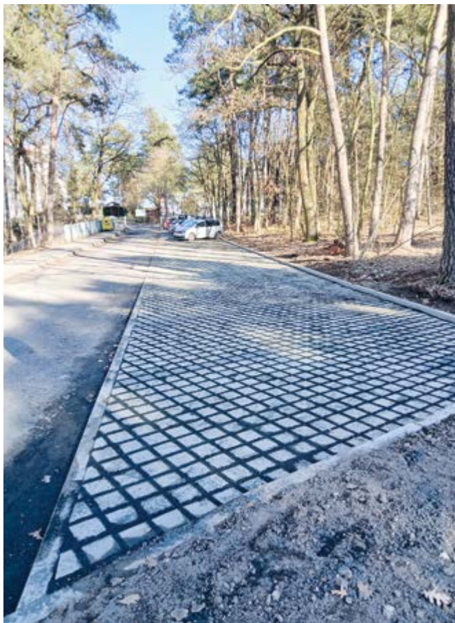
Parkoviště u domova pro seniory