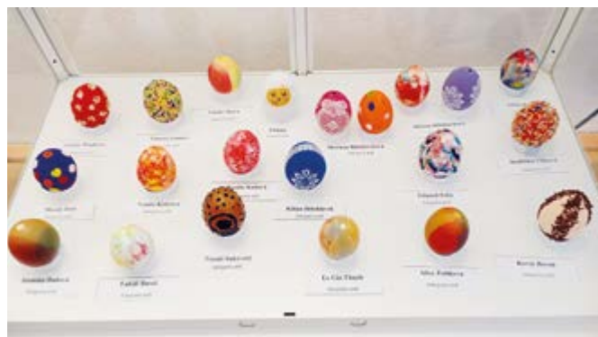
Kultura Mimoň, příspěvková organizace