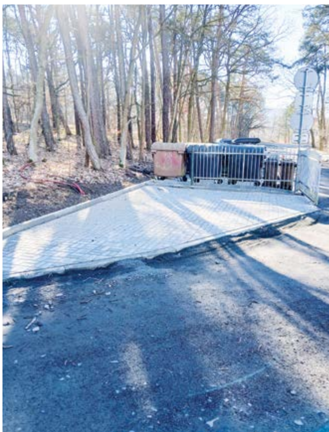
Parkoviště u domova pro seniory