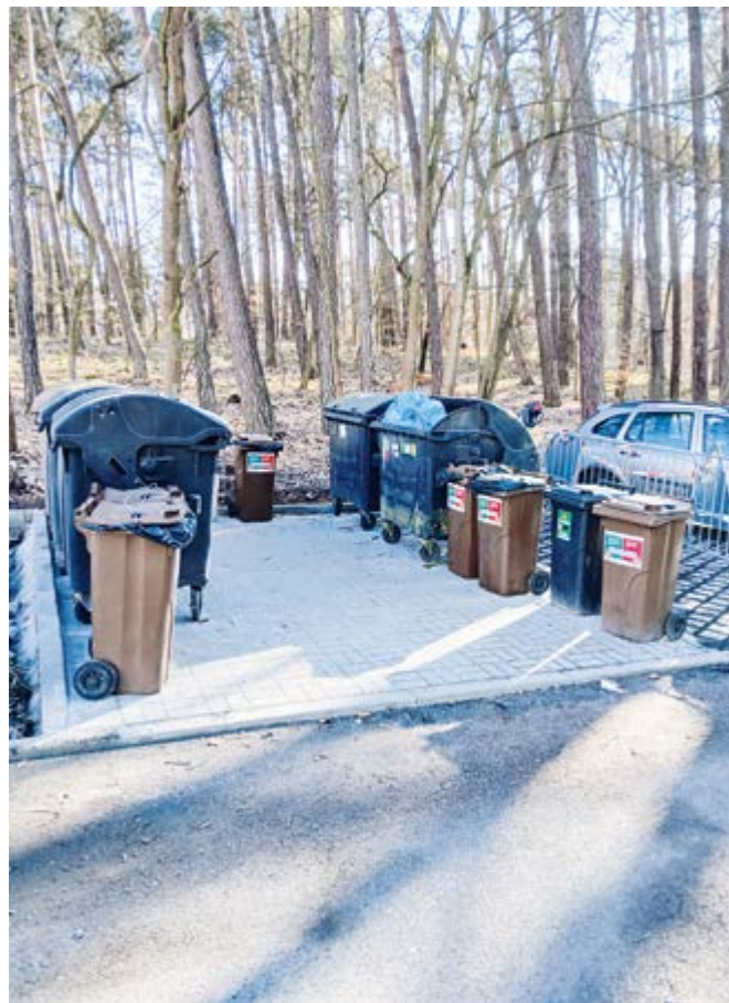
Parkoviště u domova pro seniory