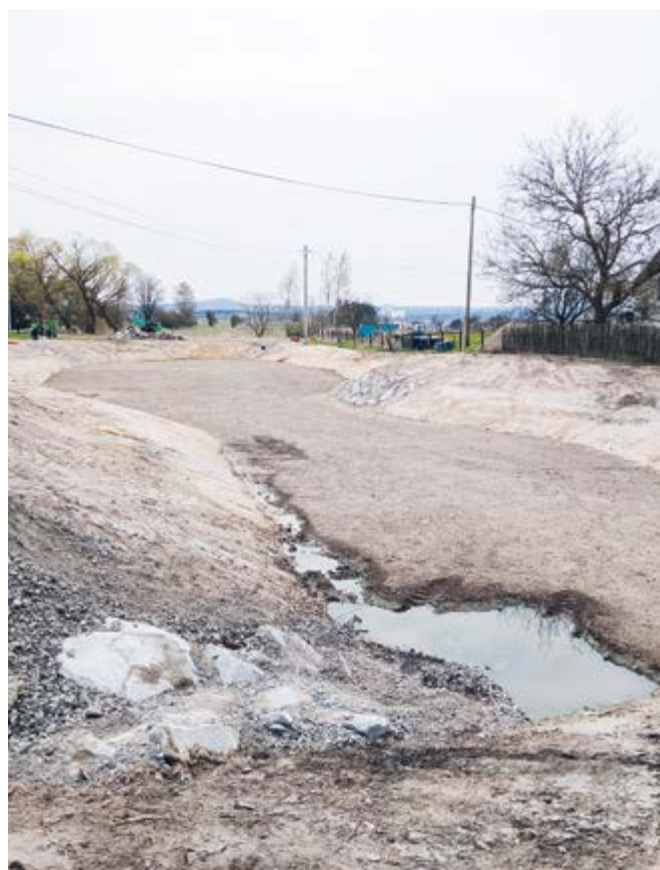
Poldr ve Vranově pod Ralskem