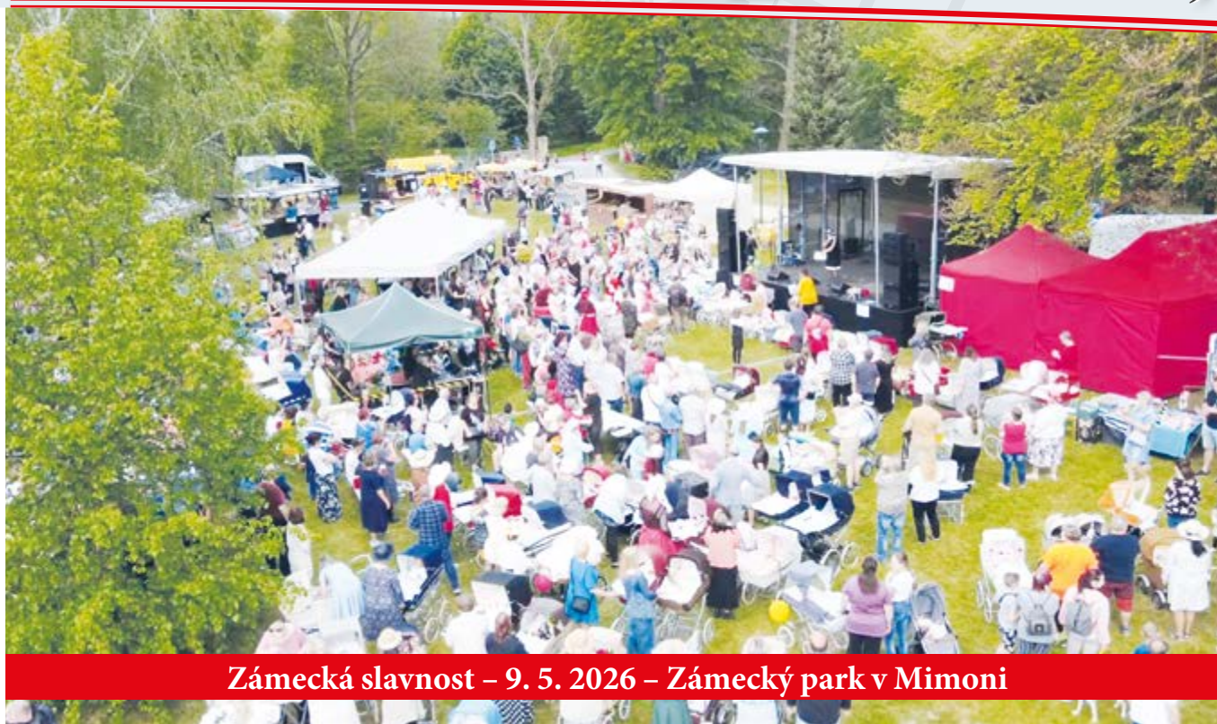
Zámecká slavnost – 9. 5. 2026 – Zámecký park v Mimoně