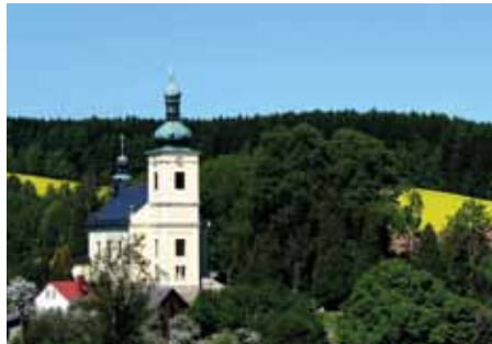
Kostel svaté Kateřiny Alexandrijské je dominantou podkrkonošské obce Mříčná.

Semilsku. Hodnotitelská komise ocenila zejména komplexní přístup k celkovému rozvoji obce v oblasti vzdělávání, mládeže, společného života a životního prostředí. Mezi dalšími oceněnými jsou např. Bozkov (za společenský život), Prusk (činnost mládeže) nebo Kruh (péče o zeleň a životní prostředí).