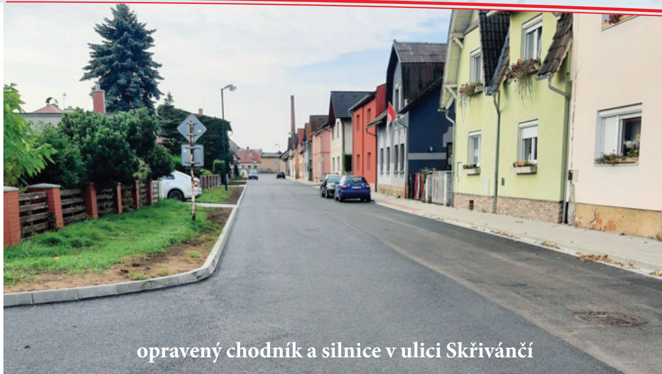
opravený chodník a silnice v ulici Skřivánčí