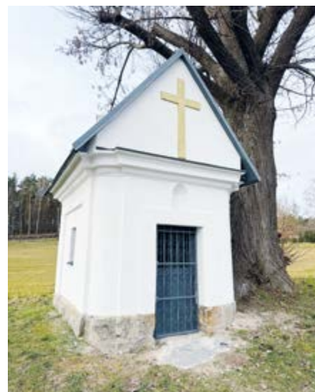
opravená kaplička ve Vranově pod Ralskem