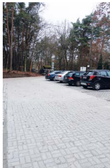
opravené parkoviště u domova důchodců