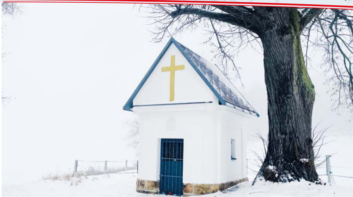
Nově opravená kaplička ve Vranově pod Ralskem