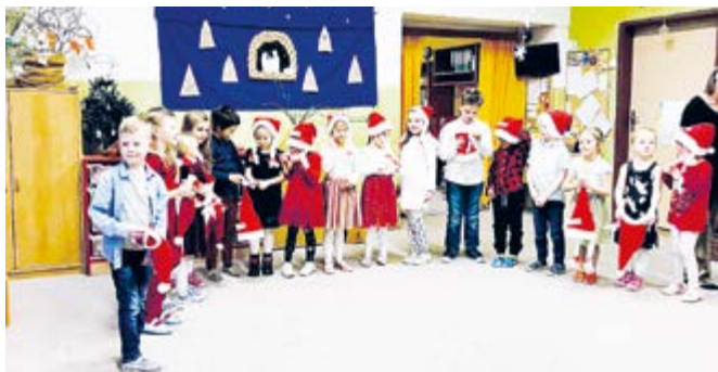
Třídní učitelky ze Sluníček

Protože jsou letos zápisy do prvních tříd netradičně brzy, pilně se věnujeme procvičování dovedností našich předškoláků. Na nadcházejících třídních schůzkách se rodiče setkají také s učitelkami z prvních tříd a děti předvedou krátkou ukázkou své práce a připravenosti. Věříme, že tato spolupráce pomůže dětem vstoupit do nové životní etapy s klidem a jistotou.