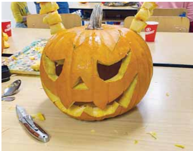
kolektiv 1. stupně

Děkujeme všem zúčastněným a kolektivu 1. st. ZŠ.