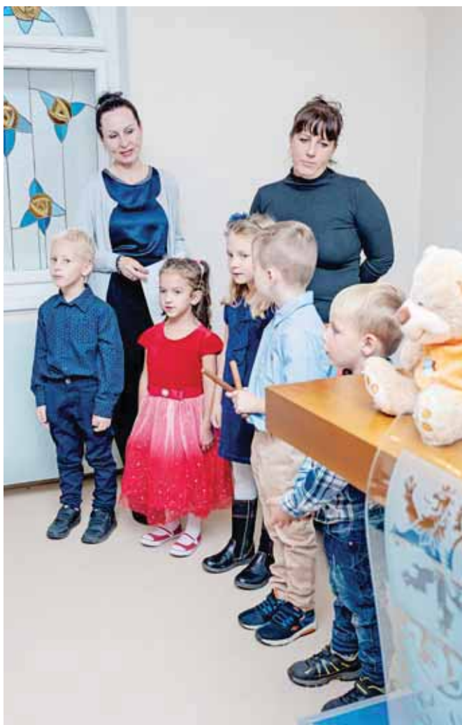
děti z MŠ