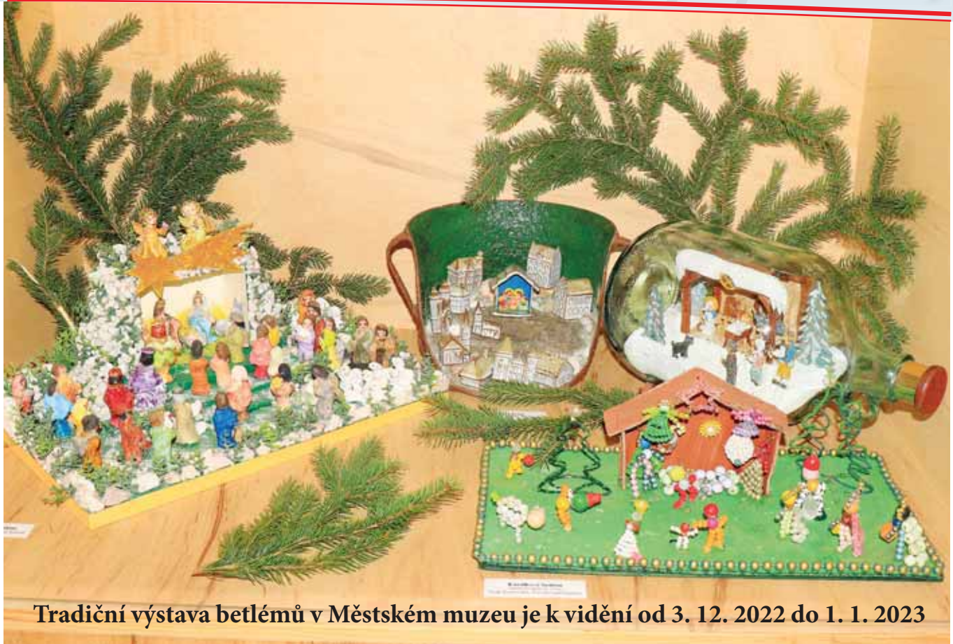
Tradiční výstava betlémů v Městském muzeu je k vidění od 3. 12. 2022 do 1. 1. 2023