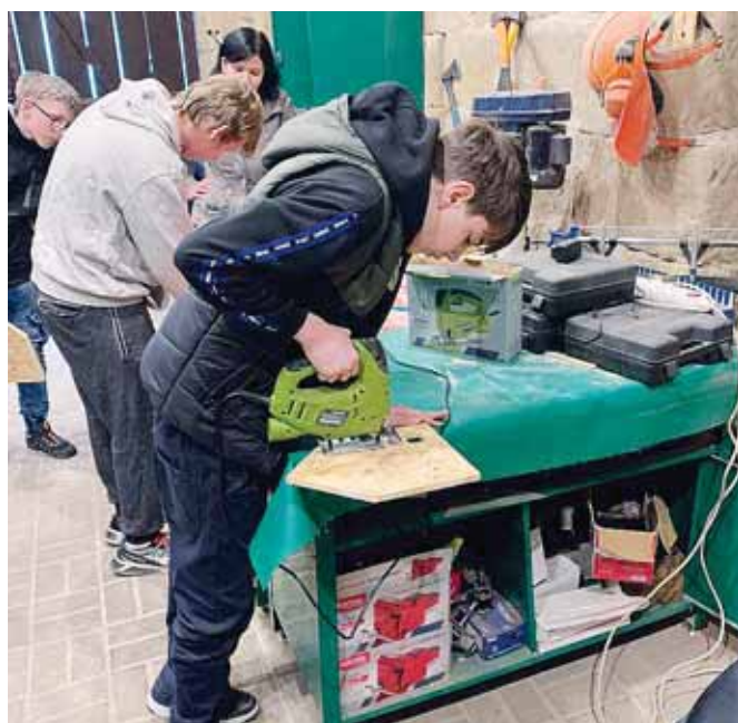
Žáci 8. a 9. ročníku speciálních tříd

Byla to opravdu zajímavá exkurze, která stála za to čekání.