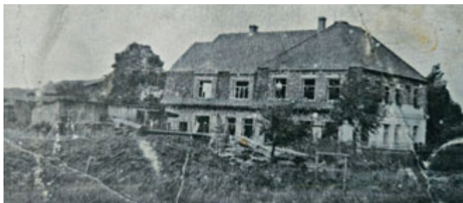
Za Spolek historie Mimoňska L. Š.

Od pana Hermana to byl v té době (existenci Sudet) velice odvážný a záslužný čin. Že mu byl za tento skutek jeho dům českým státem vyvlastněn, to už je jiný příběh.