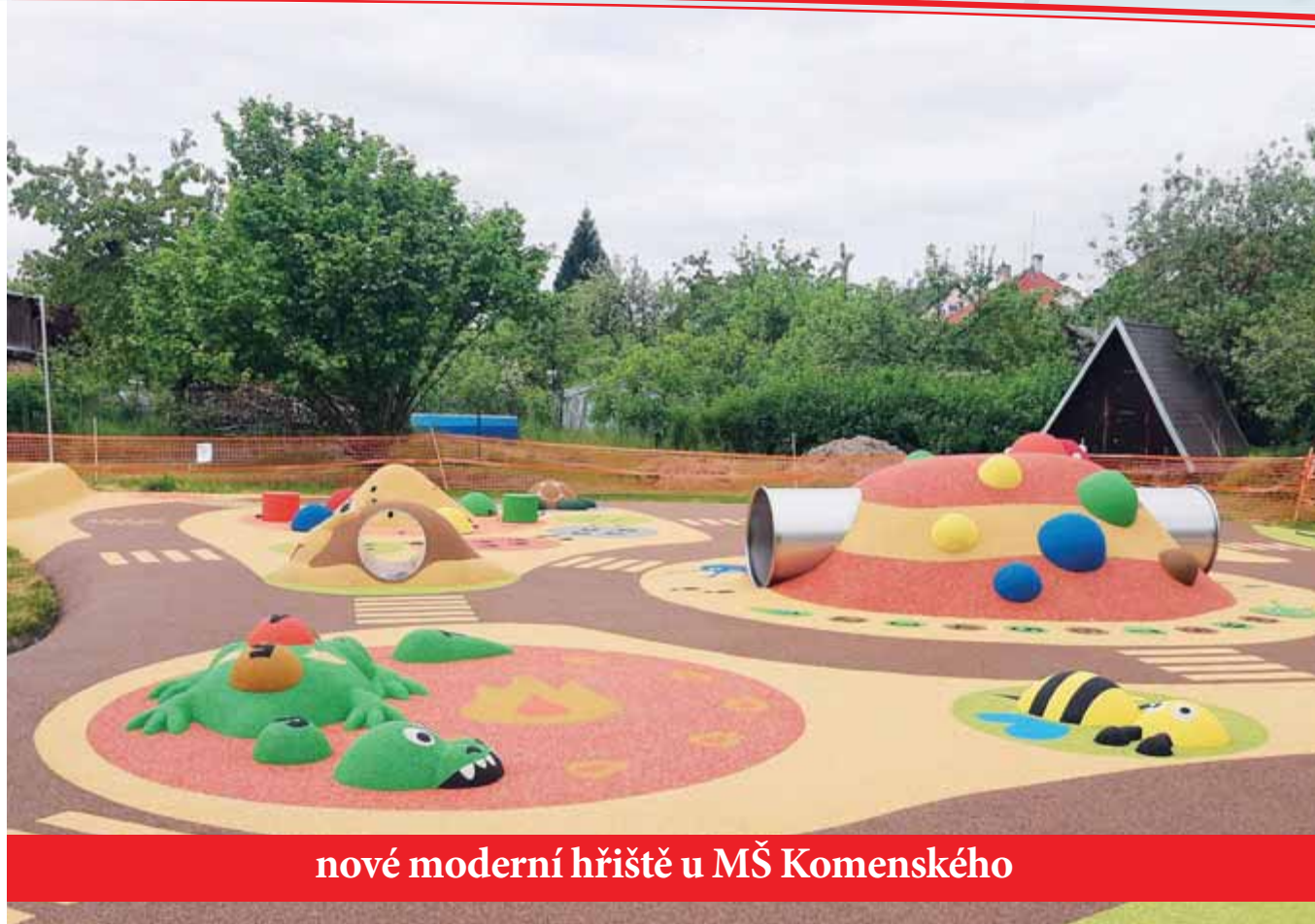
nové moderní hřiště u MŠ Komenského