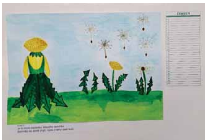
Ukázka z kalendáře červen, velikost obrázku A3 šířka

nedatované a dají se použít pro jakýkoli rok a bylo by hezké tyto obrázky v kalendáři posunout dále a např. pomocí vás vytisknout, aby aspoň jeden z těchto kalendářů měl šanci na vytisknutí. Vše se odvíjí od nákladů na tisk. Ač děkuji zřizovateli za určitou částku pro tvoření našich seniorů a řediteli p.o. za část příspěvku na výtvarný obor, další finanční částka by zatížila rozpočet školy. Byla by velká škoda, kdyby obrázky s hádankami nespátřily světlo světa. Tímto bych velice ráda oslovila širokou veřejnost, sponzora, který by nám pomohl vytisknout aspoň jeden kalendář ze čtyř kalendářů, které se zrodily z obrázků žáků naší školy. Je možné obrázky po měsících na kalendář zaslat emailem, nebo se na ně můžete přijít podívat po dohodě do výtvarné dílny ZUŠ V. Snítily Mimoň.