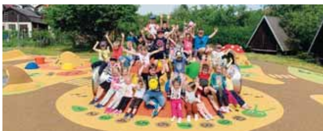
kolktiv zaměstnanců MŠ Komenského

Děkujeme vedení města, že vyslyšelo naše prosby a doslova do roka a do dne proběhla nákladná realizace, o kterou se postarala firma 4SOFT. Moc děkujeme!