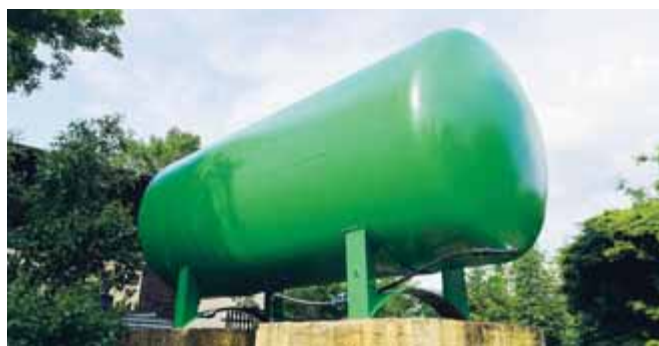
Český zahrádkářský svaz

Jen díky ochotě města Mimoň se podařilo ve velmi krátké době v průběhu letošního jara zakoupit a nainstalovat náhradní nádrž, bez níž by se stovky Mimonáků ocitly „na suchu“ a další provoz zahrádek by nebyl možný. Děkujeme tímto za poskytnutý dar z rozpočtu města jak vedení města Mimoně, tak i zastupitelům, kteří nás všichni podpořili.