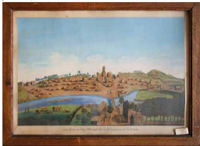
Foto: Severin Linke podle P. C. Jaksche: Pohled na Mimoň po požáru 11. června roku 1806 od Poštovského mostu, olejomalba z roku 1886 na základě starší předlohy, (uloženo na zámku Zákupy).

Z převážně dřevěných mimoňských domů zůstaly tehdy stát jen zděné komínové konstrukce. Téměř všechny městské budovy, většinou s roubenou a hrázděnou strukturou, podlehly požáru. Zoufalství obyvatel Mimoň muselo být nezměrné. Přesto bylo po čase vybudováno nové město.