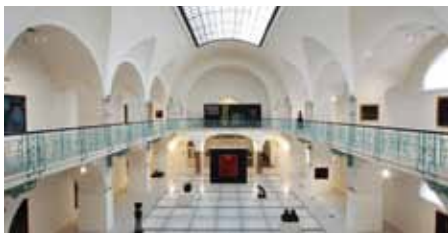
V pátek 20. května se uskuteční další ročník oblíbené akce Muzejní noc pod Ještědem, v rámci které bude možné v čase od 18 do 24 hodin navštívit vybraná muzea v Libereckém kraji.

Liberecký kraj zahájil jednání o možné koupi Nemocnice Frýdlant. Cílem je snaha o zachování akutní zdravotní péče pro obyvatele Frýdlantského výběžku a zajištění stabilní zdravotní péče pro zdejší obyvatele. „Snažíme se pomoci s řešením složité situace již několik měsíců. Uvědomujeme si totiž, že absence dostupné nepřetržité péče na Frýdlantsku je velkou nejistotou, proto jsme opakovaně avizovali, že jsme ochotni o koupi nemocnice jednat,“ uvedl hejtman Martin Půta. „Naším cílem je nejenom zajistit odpovídající péči pro takřka 30 tisíc obyvatel regionu, ale také zlepšit spolupráci nemocnic. Toto propojení nabízí záruku pro zajištění nepřetržité akutní