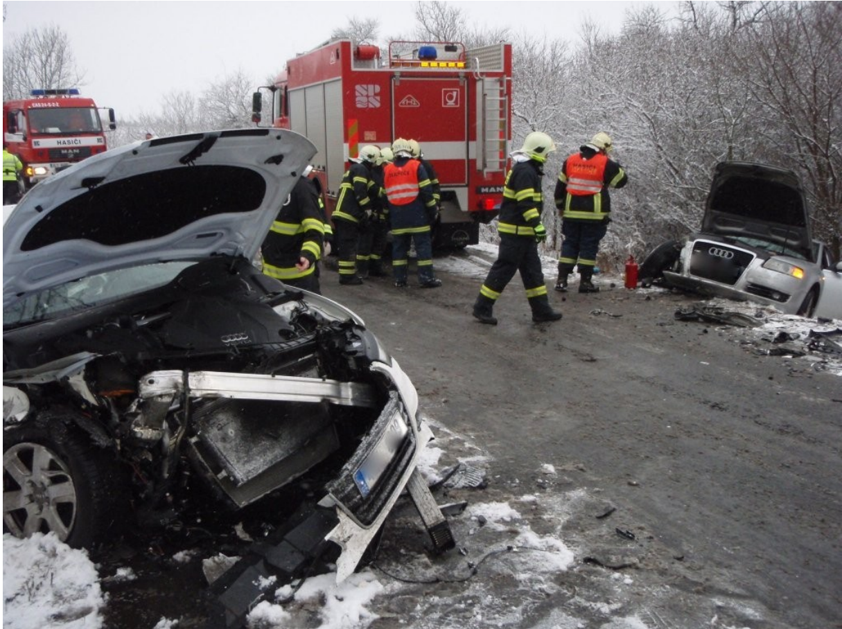
Zásah u dopravní nehody