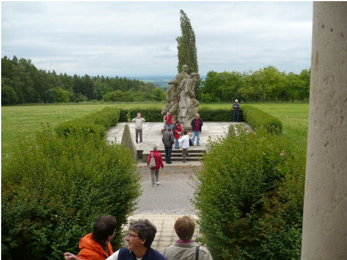
Památník před Masarykovou věží v Hořicích