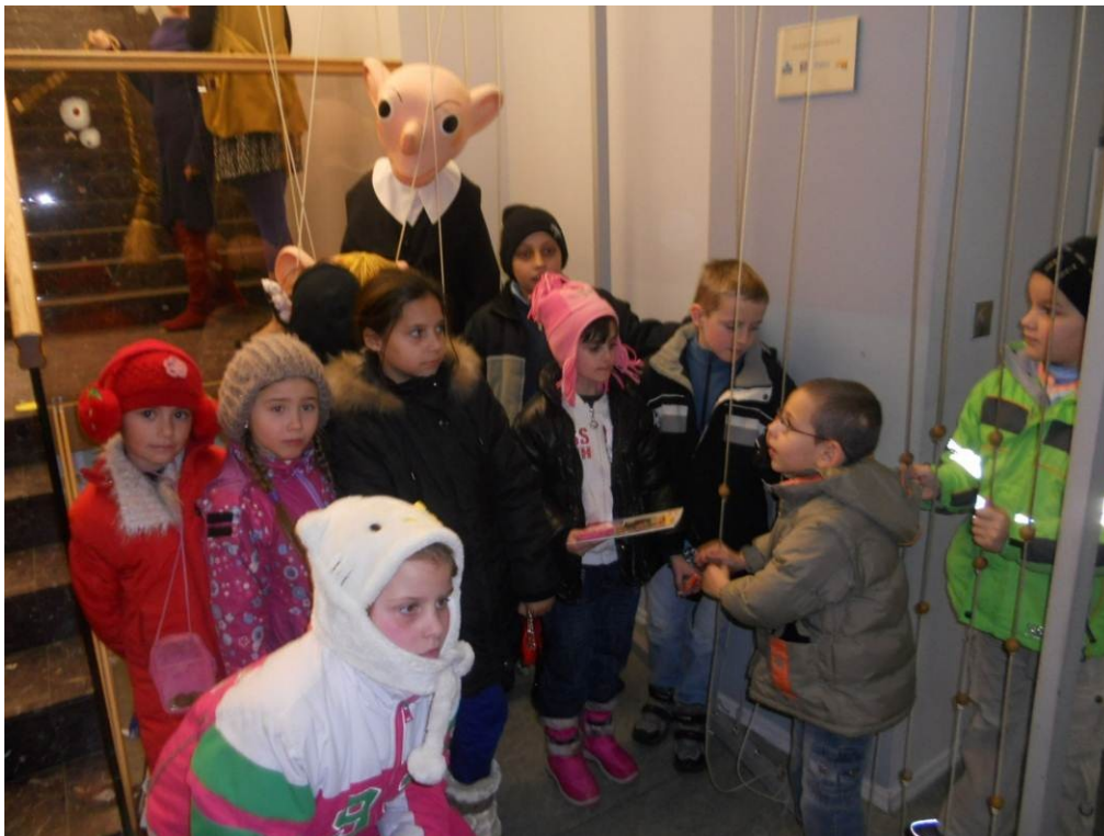
Divadlo Spejbla a Hurvínka