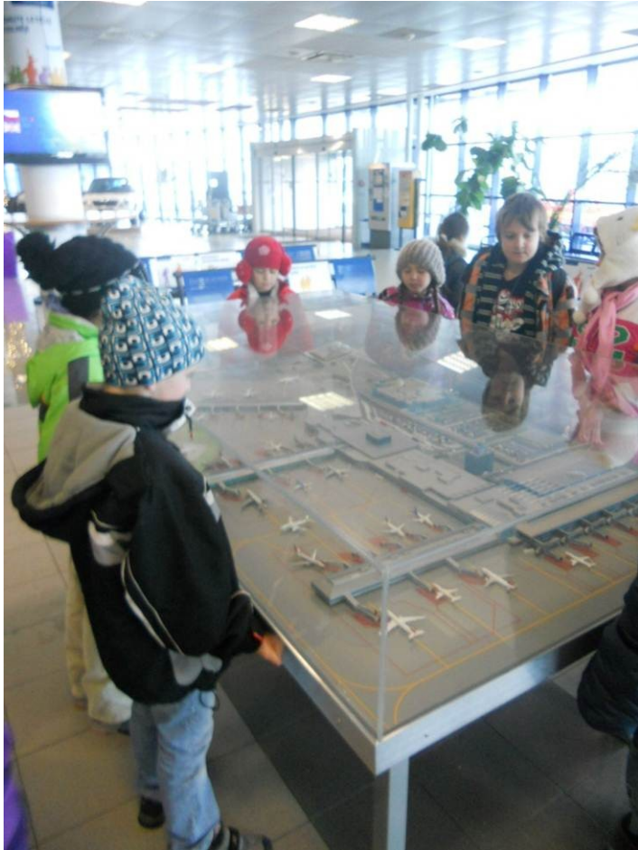
Letiště Václava Havla