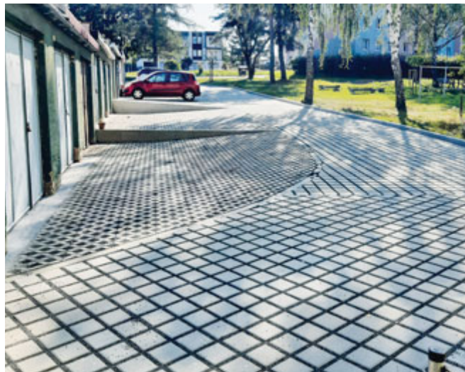
cesta u garáží U Nemocnice

A teď samozřejmě nějaké fotografie dokončených oprav ve městě, abyste nemuseli chodit přes celé město.