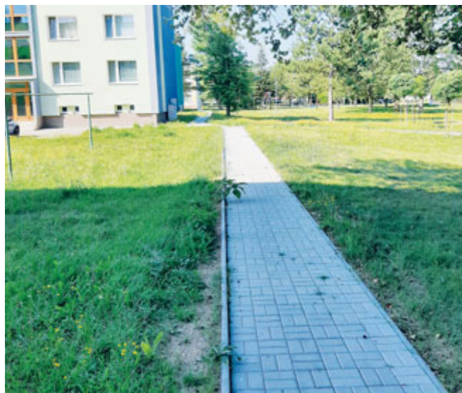
opravené chodníky na sídlišti U Nemocnice